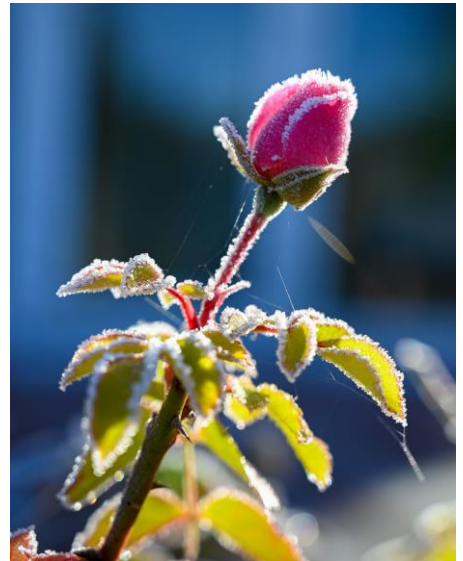
Vitalijos užfiksuotas gamtos vaizdas

Buvimas gamtoje lydi nuo mažų, nes visą vaikystę praleidau kaime, o aplink namus visur žydėjo mamos išpuoselėti gėlynai. Fotografija atsirado visai neseniai, nes visada norėjosi pagauti kiekvieną akimirką ir jos nepaleisti.