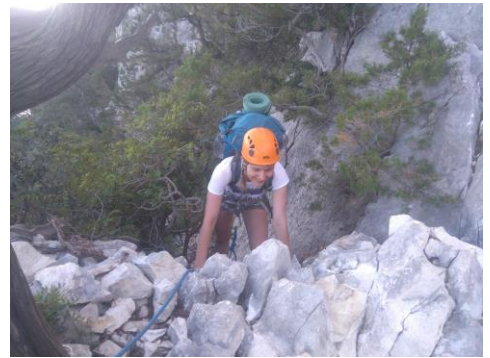
Mokytojos Sigitos kelionių akimirkos

Tie puikieji pabėgimai iš komforto zonos!